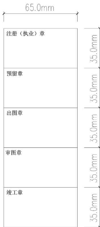
图 4.2.2-1 盖章栏组合图

1 盖章栏应包含 5 个盖章位，依次为注册（执业）章位、预留章位、出图章位、审图章位、竣工章位。每个章位尺寸应为 65mm×35mm，章位名称靠左上角布置，并按图 4.2.2-1 竖排组合。